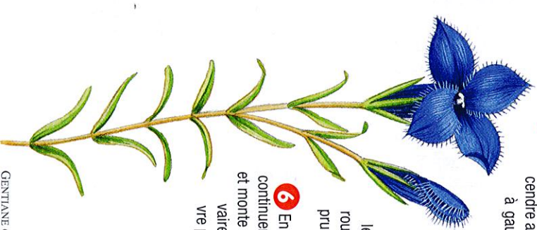
GENTIANE CLIVEE / DESSIN N. L.

6 En bas du village, bifurquer à gauche, continuer par le sentier qui franchit un thalweg et monte au hameau du Chemin. Gagner le calvaire, descendre par le sentier et poursuivre par la D 6 pour rejoindre l'église.