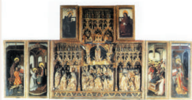
Retable de la Passion à l'église Saint-Roch

beauté de ses représentations. Consacré à la Passion du Christ, il montre les scènes du Christ dans le jardin des Oliviers, sa Crucifixion, sa Mise au tombeau, sa Descente aux limbes puis sa Résurrection.