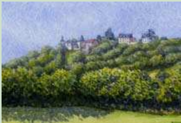
Le Village de Champallement

Le chemin qui mène actuellement à l'emplacement des ruines était autrefois une voie éduenne qui reliait Autun à Entrains/Nohain et traversait le village situé à flanc de colline.