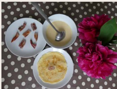
Crapiaux du Morvan