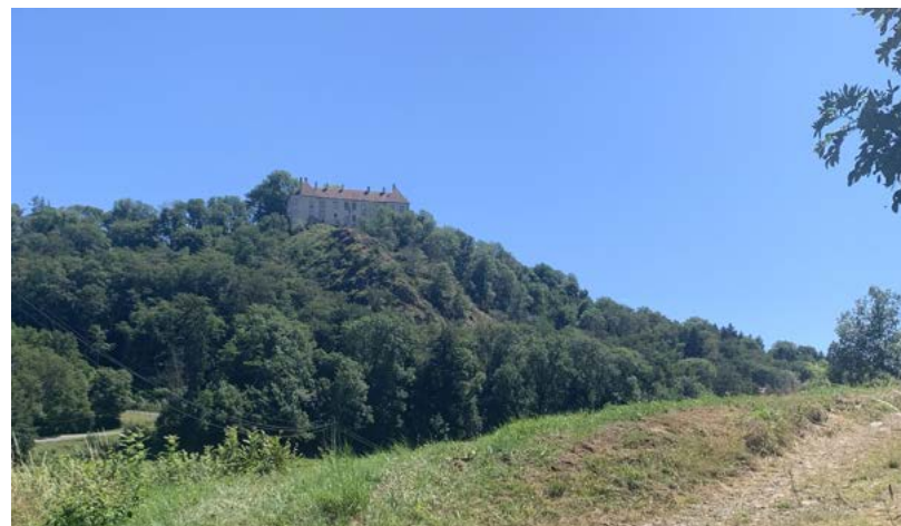
Vue sur le château de Larochemillay

6 Prendre le chemin forestier à droite sur 3 km, puis emprunter la D 27 à droite. Au carrefour, suivre la route à gauche et franchir le pont sur la Roche. Bifurquer sur la D 192 à droite et atteindre le pied de la butte. Monter par le sentier à droite et retrouver la place de l'Église.