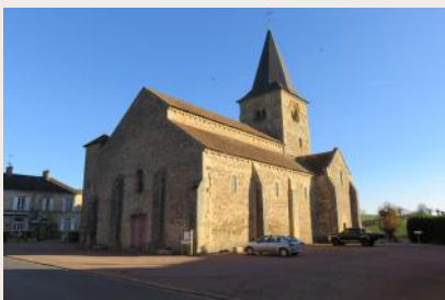
Eglise de Sémelay

différents et 4 pilastres aux moulures variées. L'église de Sémelay est le seul édifice de Bourgogne dont les chapiteaux représentent pour la plupart le mal, le péché et les châtements.