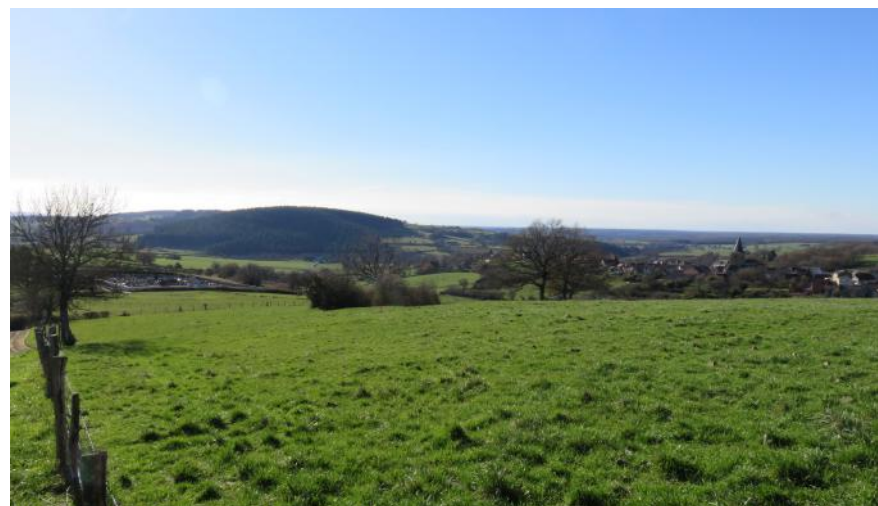
Au loin, les premiers contreforts du Morvan