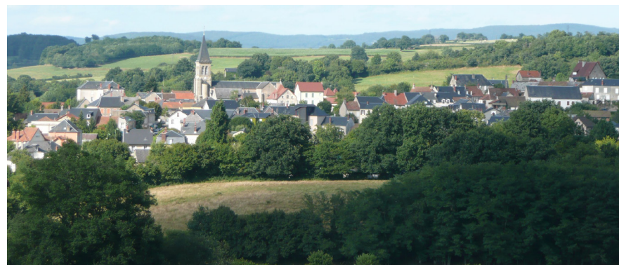
Panorama sur Saint-Honoré-les-Bains