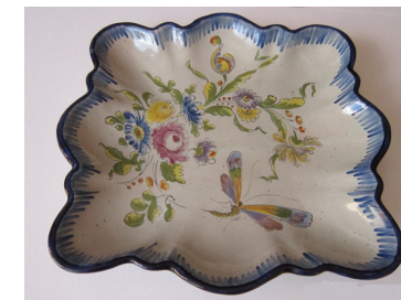
Faïence de Saint-Honoré-les-Bains